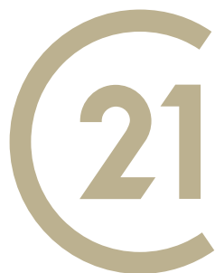
CENTURY 21 Innovation