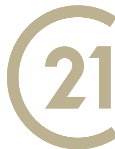
CENTURY 21 Elite